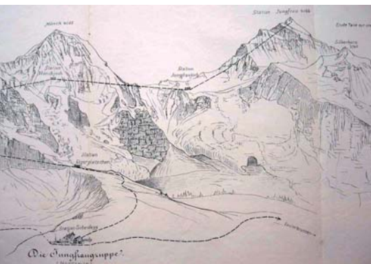
Abb. 9: Projekt Jungfraubahn 1896.

sein Erstlingswerk, das Panorama vom Tomlishorn. Es erschien 1877 als Faltpanorama mit einer Länge von 314 cm im Verlag von C. F. Prell und wurde im Jahrbuch 1878/79 des SAC als «artistische Beilage» veröffentlicht.