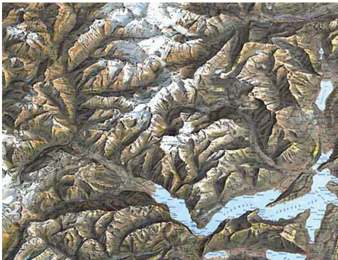
Abb. 3: Reliefkarte der Centralschweiz 1887.

Ab 1870 erfolgte unter Oberst Hermann Siegfried (1819–1879) die Veröffentlichung des Schweizerischen Topographischen Atlas, 1:50 000 für die Gebirgs-