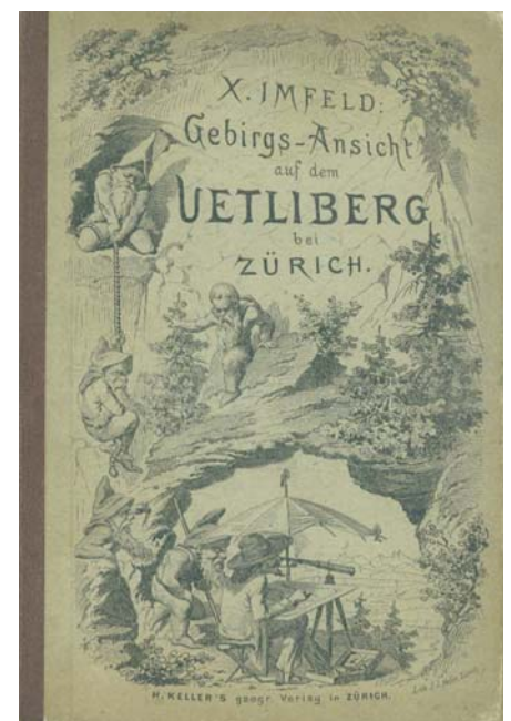
Abb. 8: Umschlag Panorama Uetliberg.