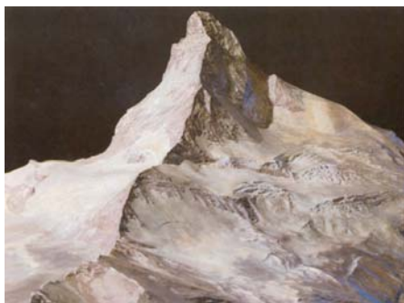
Abb. 5: Matterhorn-Relief 1896.

blätter und 1:25 000 für die Kartenblätter im Jura und Mittelland. Als Grundlage dienten die Aufnahmeblätter des Dufouratlas, die revidiert oder neu aufgenommen wurden. 1876 bis 1890 arbeitete Imfeld im Eidgenössischen Topographischen Bureau in Bern für den Siegfriedatlas. Als Gebirgstopograf und Spezialist für Felszeichnungen beschäftigte er sich mehrheitlich mit Revisionen und Neuaufnahmen der Kartenblätter der Zentralschweiz, des Berner Oberlands und des Wallis. Imfelds Felszeichnungen sind meisterhaft, wirken dreidimensional und geben die harten Kanten und Ecken des Granits ebenso wirklichkeitsgetreu wieder wie die Bänderungen des Kalks oder deren Schuttkegel am Fuss von steilen Schneisen.