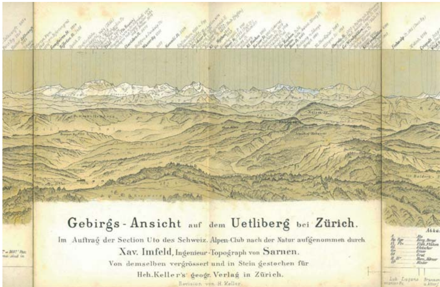
Abb. 7: Panorama Uetliberg 1877.