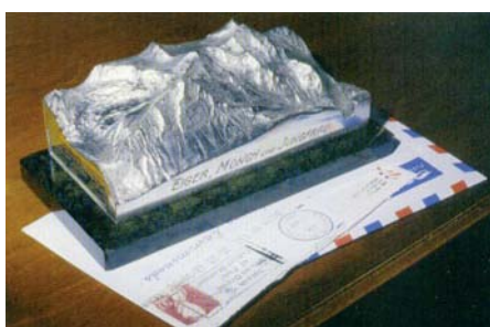
Abb. 6: Briefbeschwerer-Relief.

Seit etwa 1870 entwickelten sich in der Schweiz die so genannten Reliefkarten, «Kombinationen von Höhenkurven, Fels-schraffuren, plastisch wirkenden Schattierungen unter der Annahme seitlichen Lichteinfallens und naturähnlicher, luftperspektivischer Farbtöne» (E. Imhof). Diese Art der Reliefdarstellung auf Karten ist eine Besonderheit der Schweizer Kartografie, die in der Fachwelt unter dem Begriff «Schweizer Manier» bekannt wurde.