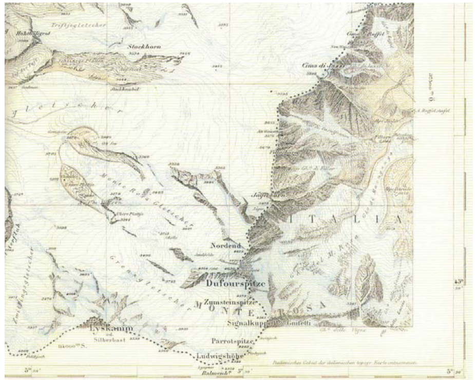
Abb. 2: Siegfriedatlas, Blatt Zermatt.